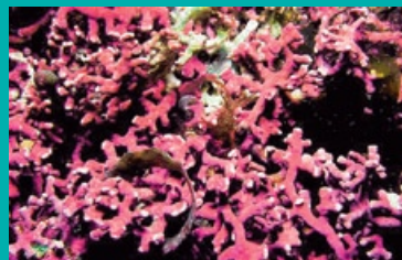
Червени водорасли – Lithothamnion Sp.

Този продукт е съчетание на естествена храна от морето – мястото, от където е започнал животът на нашата планета. Осигурява специален подбор хранителни вещества, важни за доброто здраве и общо състояние. Това е смес от три различни вида морски водорасли: кафяви, червени и зелени водорасли, в комбинация с AquaSource водорасли (синьо-зелени водорасли). Всеки един вид се е развивал в продължение на милиони години и расте на различни места, т.е. приспособил се е към много различни условия и климат и съдържа широк спектър хранителни микроелементи. Поради елементарната си структура, тези растения се усвояват изключително лесно от човешкия организъм. Когато са съчетани, техният хранителен профил е много по-балансиран, отколкото когато са по отделно. Така, на база грам от теглото си, тази смес е изключително богата на хранителни вещества. Продуктът съдържа цели органични изсушени растения, а не екстракти, в които липсва създаденият от природата баланс.